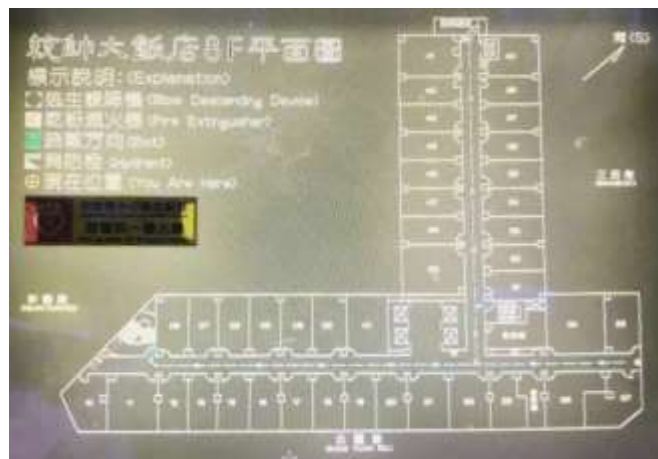
圖 9 統帥大飯店平面圖(8F)