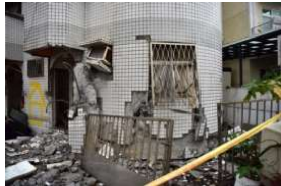
(d)一樓柱及外牆破壞