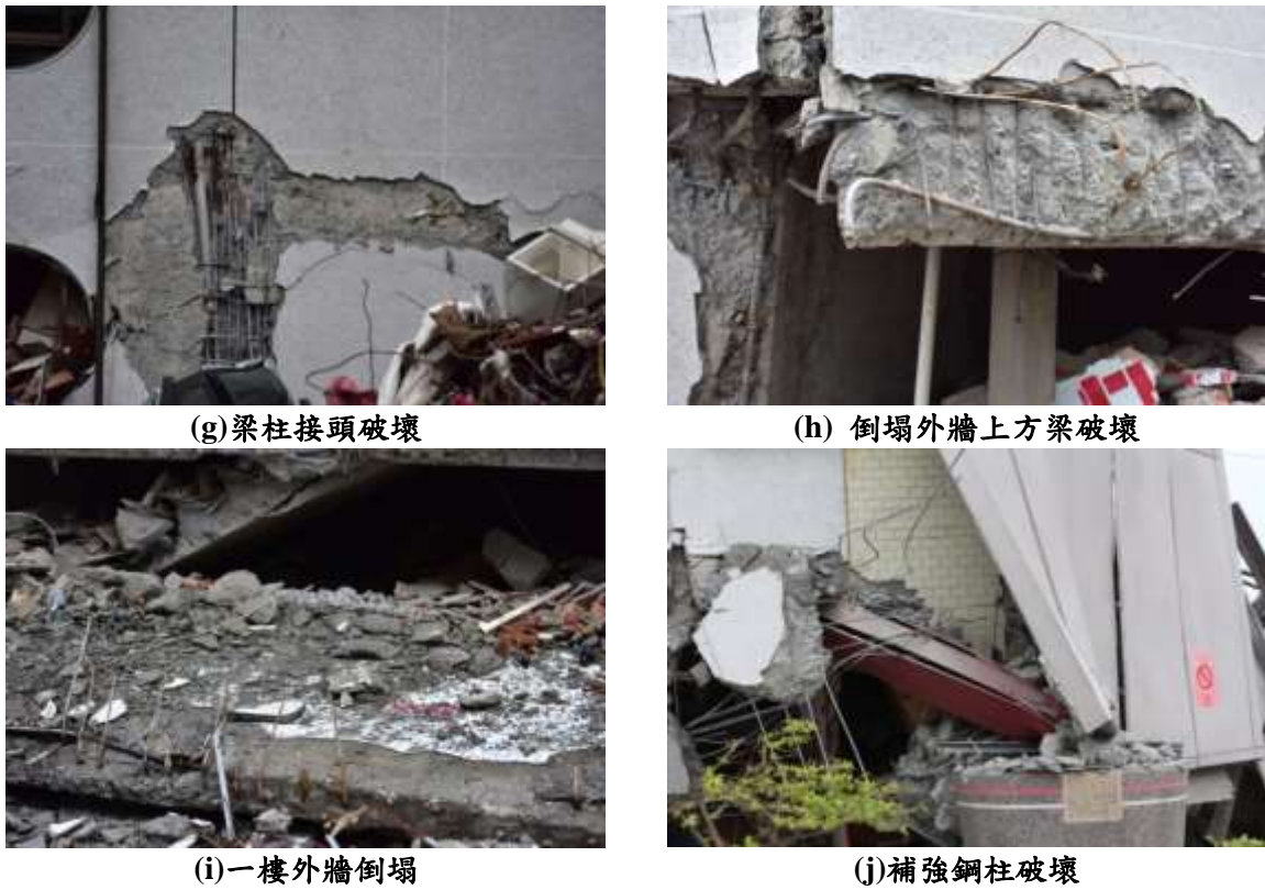
圖 8 統帥大飯店勘查照片(接續前頁)