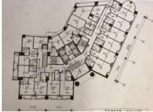
圖 5 建築平面圖(2F)

雲門翠堤大樓為 12 層樓高之鋼筋混凝土建築，在本次地震中倒塌而造成嚴重傷亡。該棟建築之一樓至三樓為商業用途，三樓以上為住宅用途。由建築平面圖(圖 5)可知，該棟結構可能具有平面不規則之特性，可能需探討是否有結構扭轉之疑慮，然因本棟建築已嚴重崩塌，並無法於現場觀察確認，尚待後續蒐集結構圖說以進行深入之分析探討。