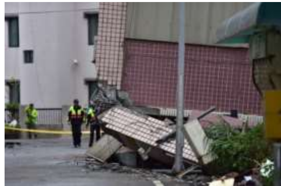
(d)一樓柱及梁柱接頭破壞(背面)