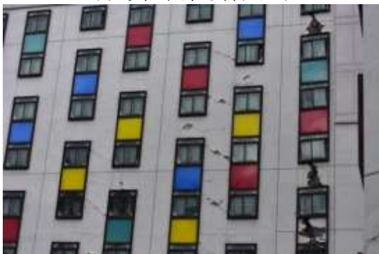
(e)建築外牆受損(背面)