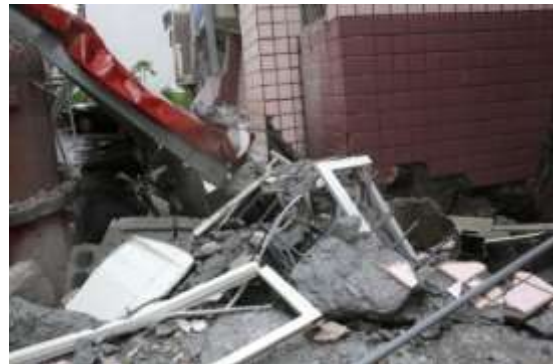
(f)一樓柱破壞近照(側面)