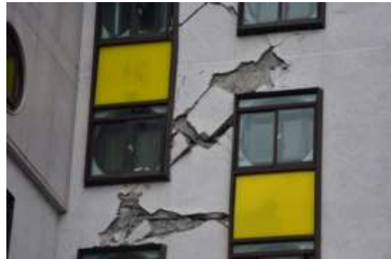
(d)建築外牆受損近照(側面)