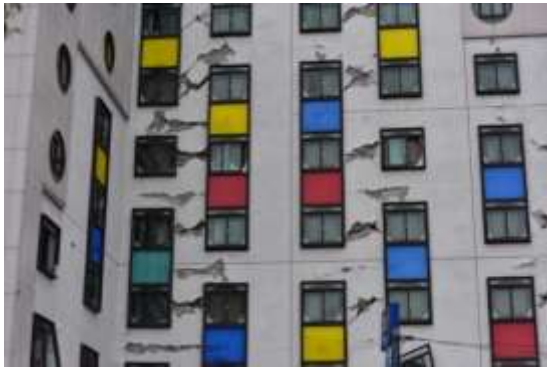
(c)建築外牆受損(側面)