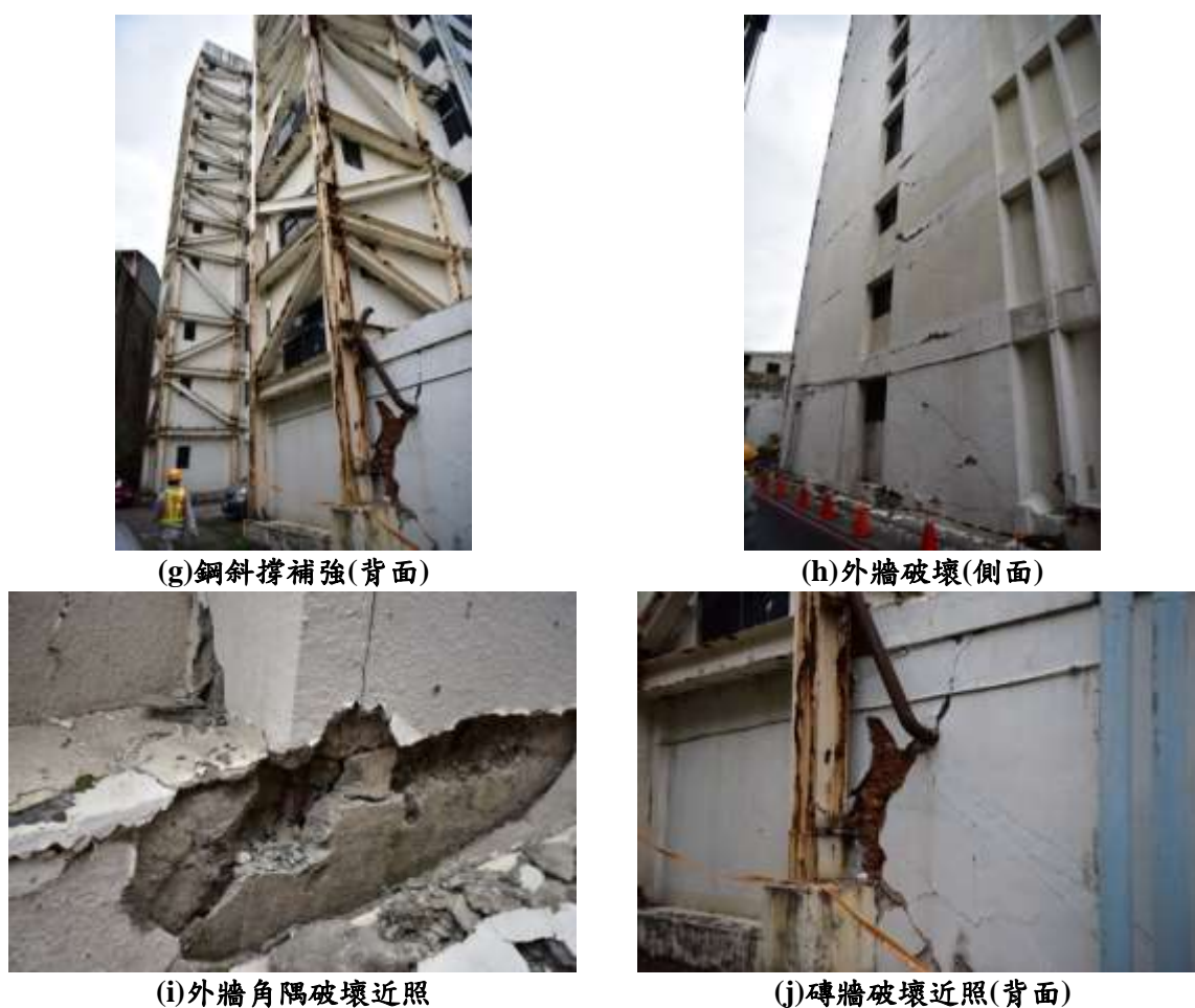
圖 10 舊遠東百貨大樓勘查照片(接續前頁)