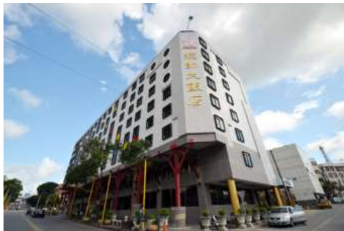
圖 7 統帥大飯店原貌(摘錄自 Google 街景[2])

統帥飯店興建於西元 1978 年，為 11 層樓高之鋼筋混凝土建築，於本次地震中因底層 1、2 樓發生破壞而崩塌。該棟建築為飯店經營之商業用途，1 樓為飯店大廳之開放空間，2 樓作為餐廳之用，3 樓以上則為飯店之住宿房間樓層，故推測其 1、2 樓隔間牆量較其他樓層少，軟弱底層之特性相當顯著，於低矮樓層柱承受地震作用可能較大，較易產生軸力破壞，導致結構物倒塌。由 Google 街景圖(圖 7)觀察該棟建築之外觀原貌，可發現該建築為走廊無柱之懸臂式結構，其具有立面不規則之特性，也可能為導致本次震害原因之一。