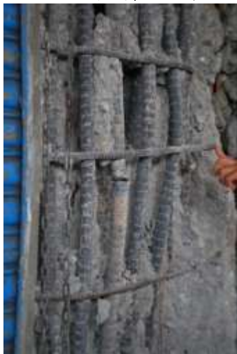
(e)柱主筋焊接點破壞