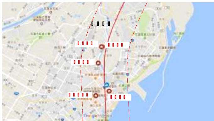
圖 2 花蓮地震倒塌或嚴重損毀建物之位置圖(於 Google 地圖上標註[2])

依據震損調查團隊之現地勘查，本次地震對於花蓮市造成嚴重損壞或倒塌之建築共有 5 棟，包含有白金雙星大樓、吾居吾宿大樓、雲門翠堤大樓及統帥大飯店等 4 棟建築物於地震中倒塌，而有 1 棟舊遠東百貨大樓則為嚴重震損。倒塌及嚴重損壞建築分佈如圖 2 所示，由建築物之位置可發現此 5 棟建築物皆臨近米崙斷層（虛線顯示為斷層線 1 公里範圍）。以下將針對本次地震造成各建築之損毀進行簡介。