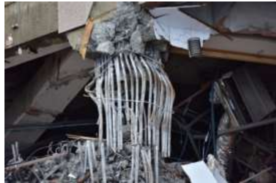
(h)柱主筋同位搭接近照