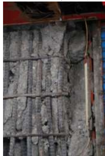
(f)柱箍筋非耐震彎鉤